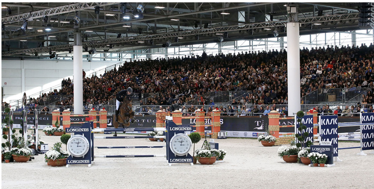
Il Pala RAM

Tre le giornate di gara del CSI5*-W, con l'atteso Gran Premio di Coppa del Mondo in programma domenica 9 come chiusura della quattro giornate dell'evento.